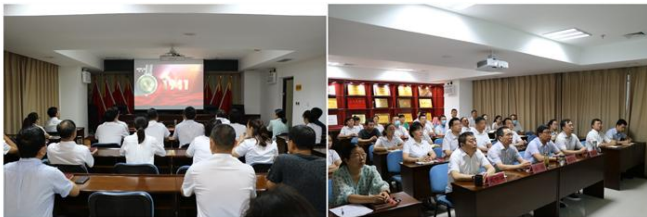
郑州办公区组织观看