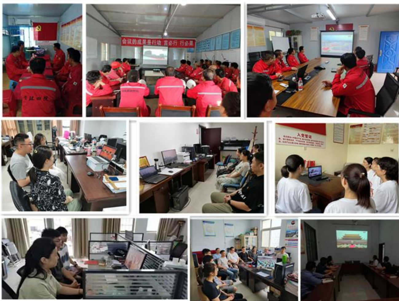
院属各单位分别组织观看